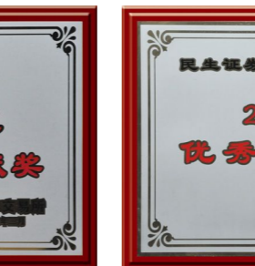
▲ 2010年荣获“优秀保荐机构”奖