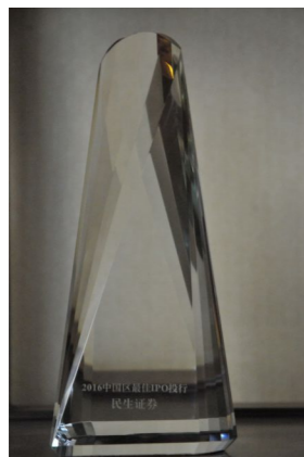
▲ 2016年荣获“中国区最佳IPO投行”