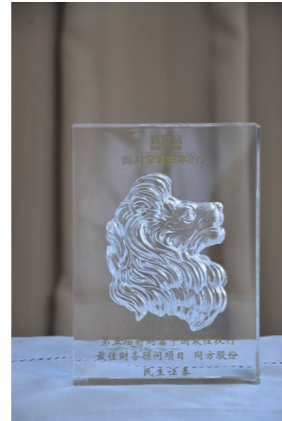
▲ 第五届新财富中国最佳投行最佳财务顾问项目同方股份