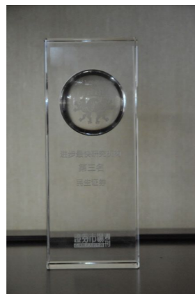
▲ 2011年荣获“进步最快研究机构”第三名