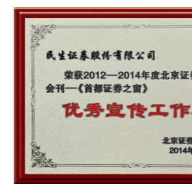
▲ 2014年荣获“优秀宣传工作”奖