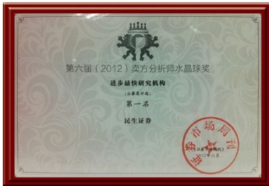
▲ 2012年荣获“进步最了研究机构”奖