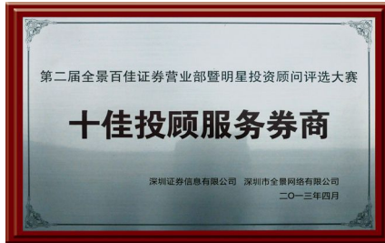
▲ 2015年荣获“十佳投顾服务券商”奖