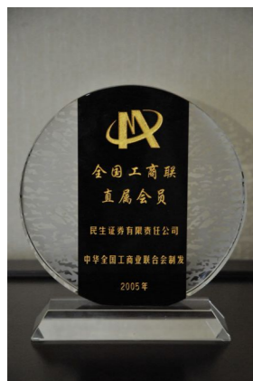
▲ 2005年荣获“全国工商联直属会员”奖