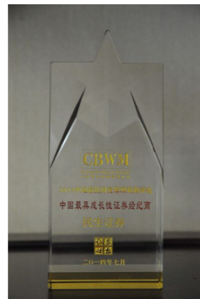
▲ 2014年荣获“中国最具成长性证券经纪商”