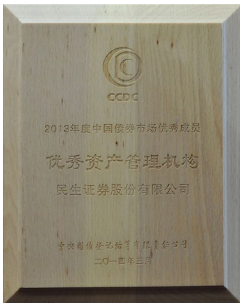
▲ 2012年荣获“优秀资产管理机构”奖