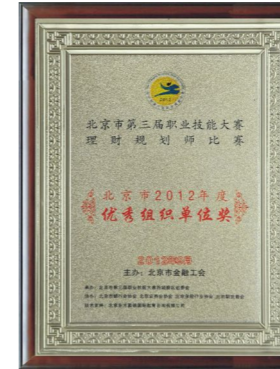
▲ 2102年荣获“优秀组织单位”奖