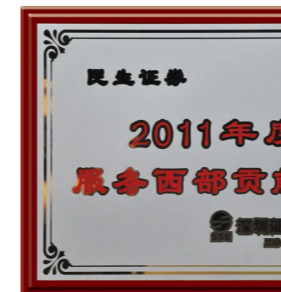
▲ 2011年荣获“服务西部贡献”奖