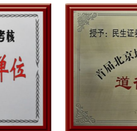
▲ 2010年荣获“道德风尚”奖