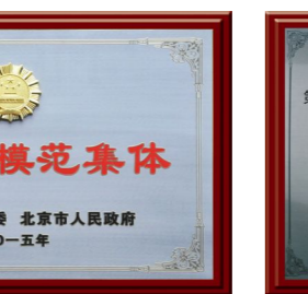
▲ 2013年荣获“十佳投顾服务券商”奖