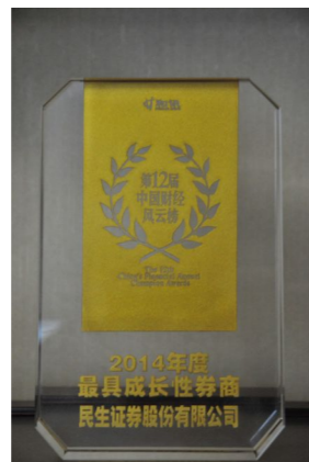
▲ 2014年荣获“最具成长性券商”