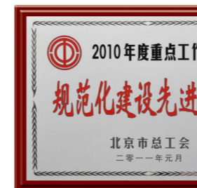
▲ 2010年荣获“规范化建设先进单位”奖