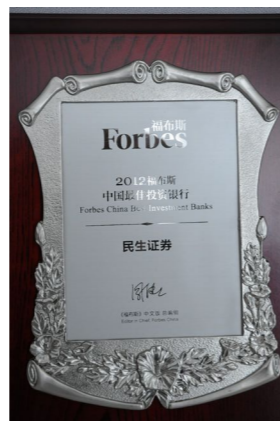
▲ 2012年荣获“福布斯中国最佳投资银行”奖