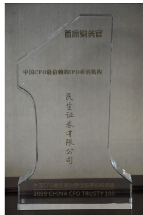
▲ 2009年荣获“中国CFO最信赖的IPO承销机构”