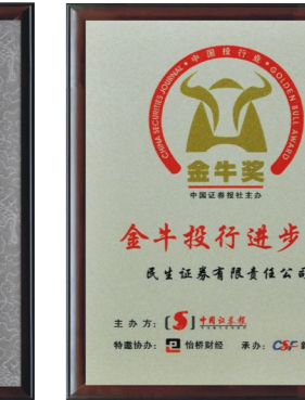
▲ 荣获“金牛投行进步”奖