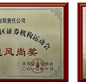
▲ 2013年荣获“优秀组织”奖