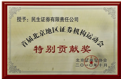
▲ 2010年荣获“特别贡献奖”奖