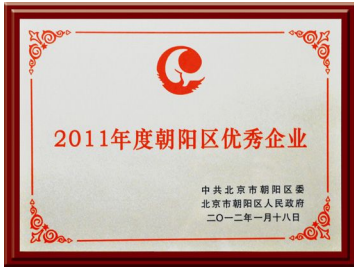
▲ 2011年荣获“朝阳区优秀企业”奖