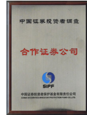
▲ 荣获“中国证券投资者调查合作证券公司”奖