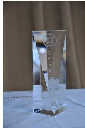
▲ 2012年荣获“金牛投行进步”奖