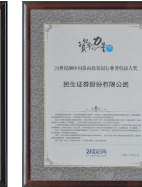
▲ 荣获“21世纪中国券商投资银行业务创新大奖”