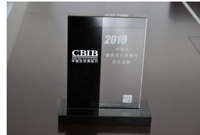
▲ 2010年荣获“最具成长性投行”奖