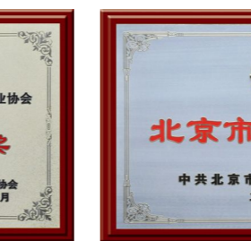
▲ 2015年荣获“北京市模范集体”奖